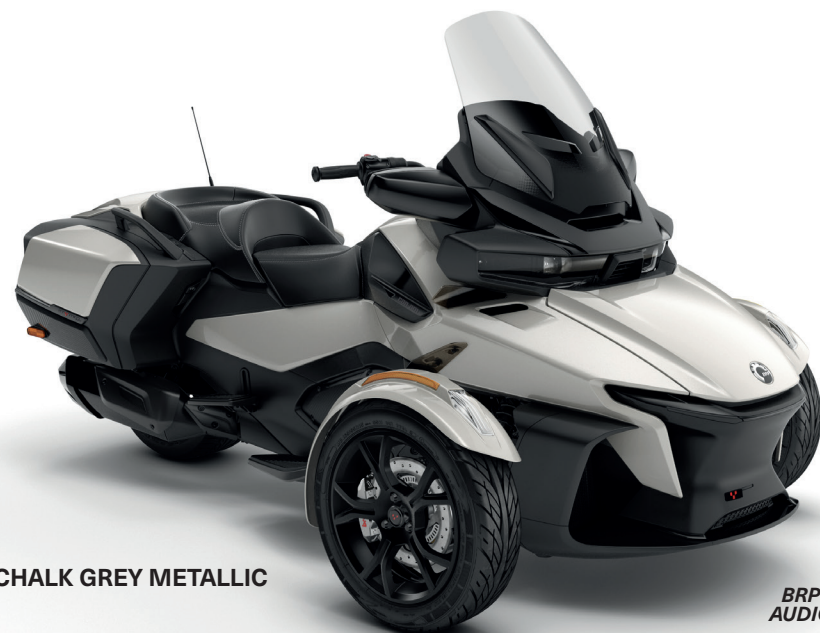
CHALK GREY METALLIC